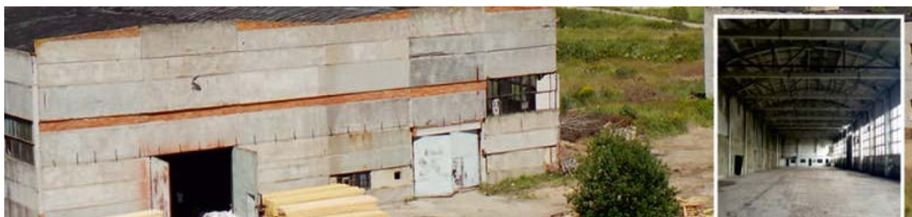
Площадь первого этажа - 3 291,0 м.кв